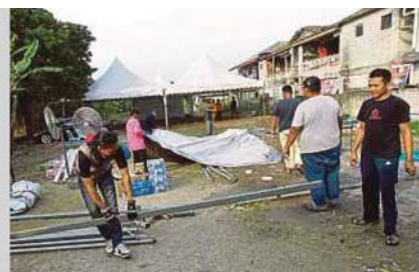
PUSAT penempatan sementara penduduk ditutup setelah semua penduduk mendapat penempatan kekal.