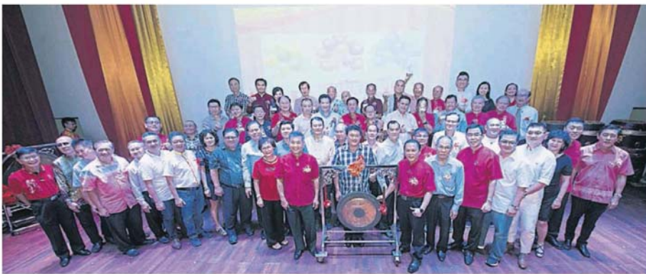
一众志成城，八打灵发展华小工委会筹逾25万令吉活动基金。图为鸣锣、撞鼓及剪彩人在开幕式后合影。

该工委会耗时3年整辑县内华小资料，晚宴也进行了《八打灵发展华小工委会庆祝成立36周年纪念特刊》推介仪式。