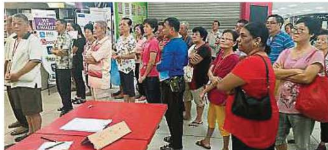
买日常用品。逾200名9月份生日的乐龄者，一早在超市排队等候购物。