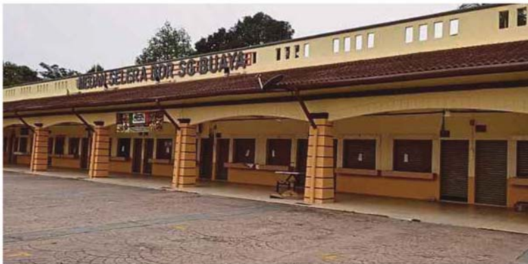
Medan Selera Bandar Sungai Buaya masih sepi perlu promosi bagi dimajukan sepenuhnya.