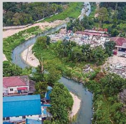
KEDIAMAN yang berhampiran sungai di Kampung Paya Jaras Hilir yang dirobohkan Kerajaan Negeri Selangor.