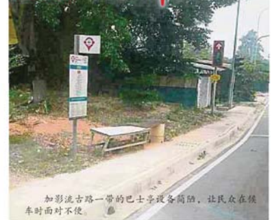
加影流古路一带的巴士亭设备简陋, 让民众在候车时面对不便。

“我发现加影流古律路 (Jalan Reko) 一带的巴士亭, 大多数都没有设置椅子让民众坐下来等车, 还有部分只有巴士站牌, 连亭子都没有, 设备十分简陋。 在基建不足的情况下, 民众在烈日下或下雨的时候等车时都变得十分辛苦, 希望加影市议会可体恤人民, 提升各个巴士亭的效能。 我相信, 若市议会因预算不足而无法展开这项提升计划, 周边的商家都会愿意伸出援手。”