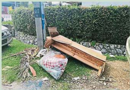
居民把大型垃圾丢弃在社区的路旁, 两个星期以来没有人来清理, 导致该处惨变垃圾场。

“我日前发现有居民把弃用的大型垃圾, 当中包括木棚及床褥丢弃在灵市百乐花园 (Taman Paramount) 20/9路的路旁, 且没有人前来清理。 此现象已有两个星期之久, 以致该处惨变垃圾场, 这有损市容之余, 也引起卫生问题。 我希望当局能够正视这个问题, 也希望民众多加爱护社区, 勿随意丢弃垃圾, 尤其是大型垃圾。”